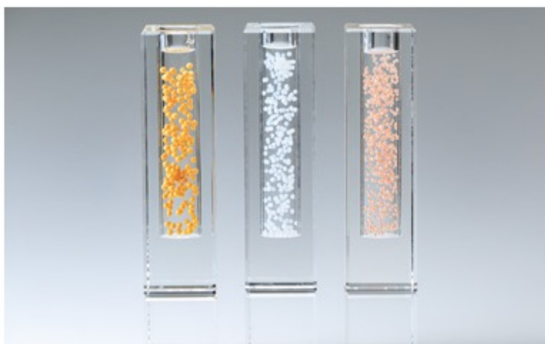
「アクアジュリエ」は登録商標です。