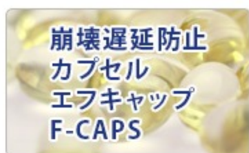
崩壊遅延防止カプセル エフキャップ F-CAPS