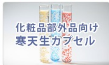
化粧品部外品向け 寒天生カプセル