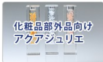
化粧品部外品向け アクアジュリエ