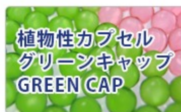
植物性カプセル グリーンキャップ GREEN CAP