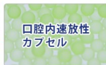
口腔内速放性カプセル