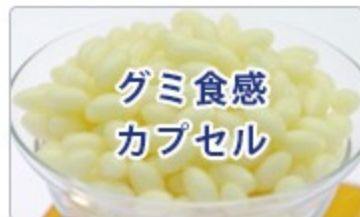
グミ食感カプセル