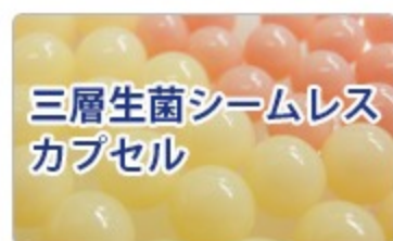
三層生菌シームレスカプセル